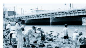
海老江干潟での自然観察会

◎日時：5月18日(日) 10:00 雨天中止 ◎場所：大阪市福島区淀川左岸・海老江干潟 ◎集合：阪神電車淀川駅改札口 10:00 ◎参加費：大人200円/中学生以下100円 ◎問い合わせ：TEL.0797-80-2045 (田淵) ★大阪のどまん中に残された小さな自然干潟(十三干潟)と人工的に作られた干潟(柴島実験干潟)に立ち寄りシギやチドリを観察します。淀川最下流の干潟。海老江干潟ではカニや貝など干潟で暮らす小さな生き物を観察します。