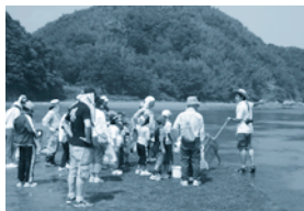
ハチの干潟での自然観察会

◎日時：5月5日(祝) 14:00 小雨決行 ◎場所：竹原市竹原町・ハチの干潟 ◎集合：賀茂川河口 皆実橋 ◎参加費：500円 ◎問い合わせ：TEL.080-3882-2372 (岡田) ★僕たち自慢のハチの干潟は、アママがびっしりとはえています。そこを「押し網」という大きな網でさぐってみよう!! たくさんの魚やエビを捕まえることができるんじゃけえ。それを実際に食べる体験もするんよ。いっぺんハチの干潟に来てみんさい!! お待ちしてまーす。