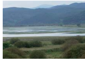
キョンサンナムドにある韓国のラムサール条約湿地「ウボ湿地」。ナクトンガン(洛東江)の遊水池で周辺には水田が広がる。

東アジアではどのように湿地を賢明に利用して、『健全な湿地 健康な人々』を実現させていくべきでしょうか。かつて広大に広がっていた干潟を破壊し続けてきたことや、自然の循環を利用して行われていた水田稲作が、農薬や化学肥料を多用して環境を破壊するものに変質してしまったことを、きちんと反省しなければなりません。