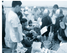
高松海岸での自然観察会

◎日時：4月13日(日) 10:00 小雨決行 ◎場所：川越町・高松海岸 ◎集合：エノキの前 ◎参加費：無料(要事前申し込み) ◎問い合わせ：TEL.059-365-6609 (水谷) ★春の高松海岸の風景を描こう!! 貝、さかな、鳥、植物、船、お気に入りの色をみんなで見合います。 ※携帯用クレヨン・絵の具等(持ち合わせがある方)