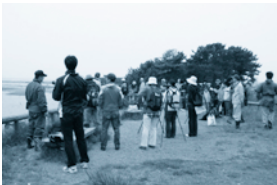
蒲生海岸での自然観察会

◎日 時：5月6日(休) 9:30 小雨決行 ◎場 所：仙台市宮城野区・蒲生海岸 ◎集 合：日和山 ◎参加費：無料 ◎問い合わせ：TEL.022-223-5025 (木村) ★5月は、冬鳥・夏鳥・旅鳥の渡り鳥が同時に見られ、蒲生干潟が最もにぎわう季節です。海岸では海浜植物が咲き始めています。干潟を一周して、春の自然を体感しましょう。