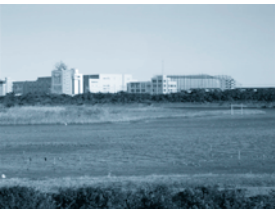
行徳野鳥観察舎からの保護区の眺め

◎参加費：無料 ◎小雨決行 ◎問い合わせ：TEL.047-397-1175 ★首都圏に残された貴重な環境、行徳野鳥保護区で自然観察会を行います。スタッフと一緒に楽しく歩きましょう。この機会にぜひお越しください。歩きやすい靴や服装で。夕暮れ観察会は冷え込むことがございます。 ※大人数になるときは事前にご連絡ください。