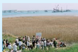
吉野川河口 (徳島県)